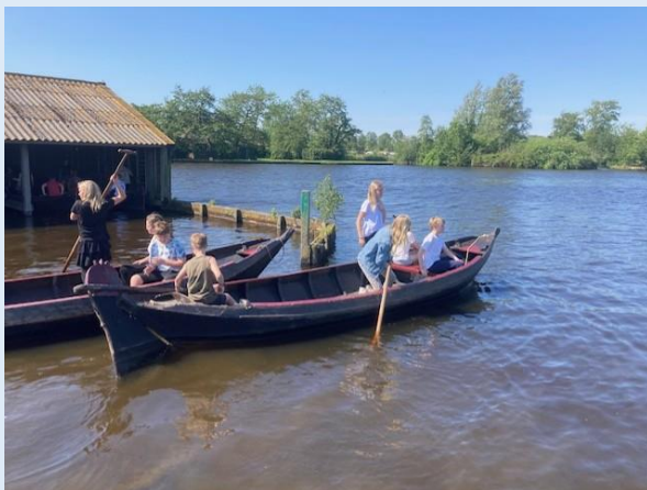
Groep 8 in Giethoorn

Meer informatie hierover staat binnenkort op Parro.