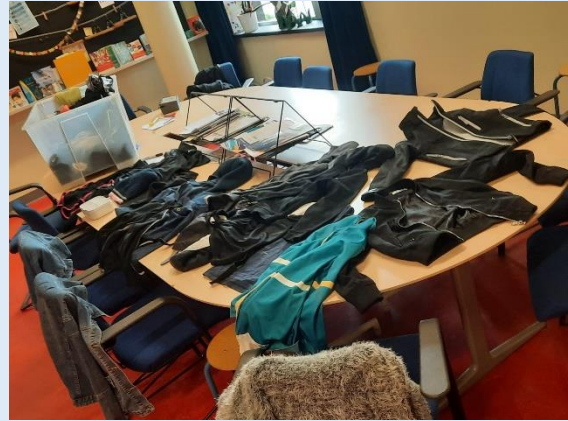
Een greep uit de gevonden voorwerpen...